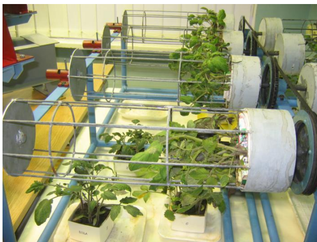
Рис. 1 Вирощування рослин помідора у кліностаці КГ-8 та стаціонарні (нерухомі) контролі

Результати досліджень. Для виявлення впливу дії цих двох чинників провели дослідження з рослинами помідора сорту Кримська сливка, штучно інокульованих М-вірусом картоплі, які культивували в умовах модельованої мікрогравітації (рис.1).