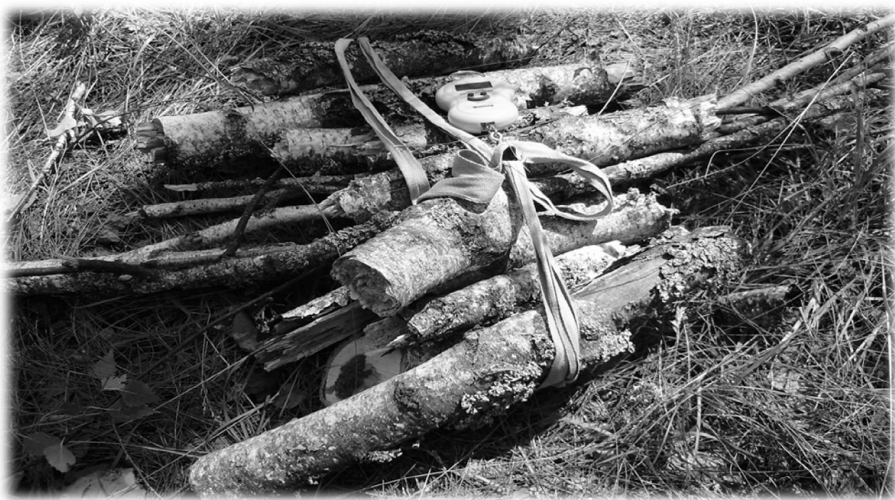
Рис. 1. Мортмаса грубих гілок берези повислої

визначення в ній вмісту абсолютно сухої речовини. Усі пробні ділянки закладалися по діагоналі або у шаховому порядку на ТПП.